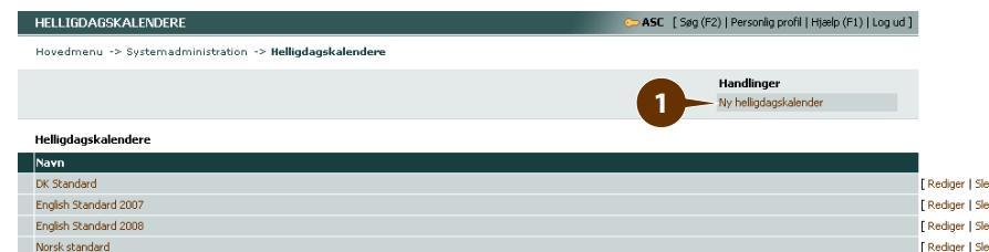
Figur2: Hovedmenu -> Systemadministration -> Helligdagskalendere -> Ny helligdagskalender